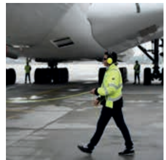
Werkzaamheden op de grond bij de luchthaven