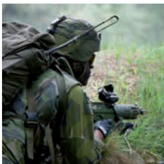
Krijgsmacht en wetshandhaving