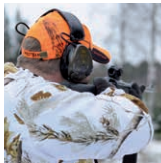
Jacht- en schietsport