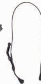
3M™ PELTOR™ MT53V/1 (ELEKTREET)