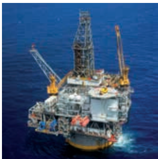
Olie en gas

Om het gebruiksgemak van onze producten en goede functies voor alle omgevingen te garanderen, gebruiken we geavanceerde technologie zoals niveau-afhankelijke technologie en Bluetooth®.