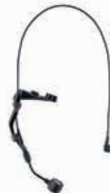
3M™ PELTOR™ MT7V/1 (DYNAMISCH)