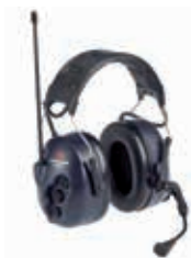
3M™ PELTOR™ LiteCom