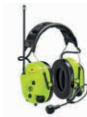
3M™ PELTOR™ LiteCom Plus