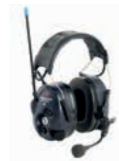
3M™ PELTOR™ WS™ LiteCom Plus